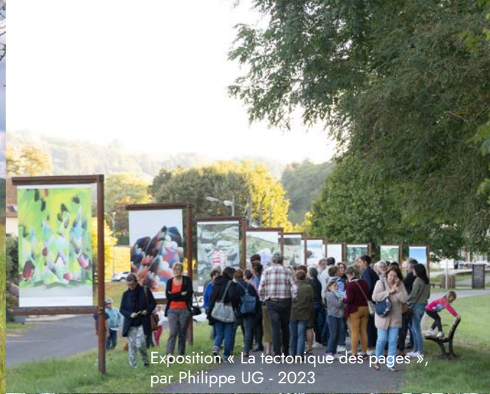
Exposition « La tectonique des pages », par Philippe UG - 2023