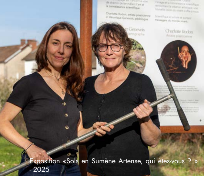
Exposition « Sols en Sumène Artense, qui êtes-vous ? » - 2025