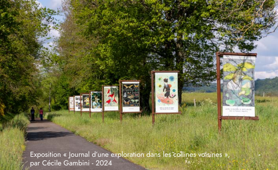
Exposition « Journal d'une exploration dans les collines voisines », par Cécile Gambini - 2024